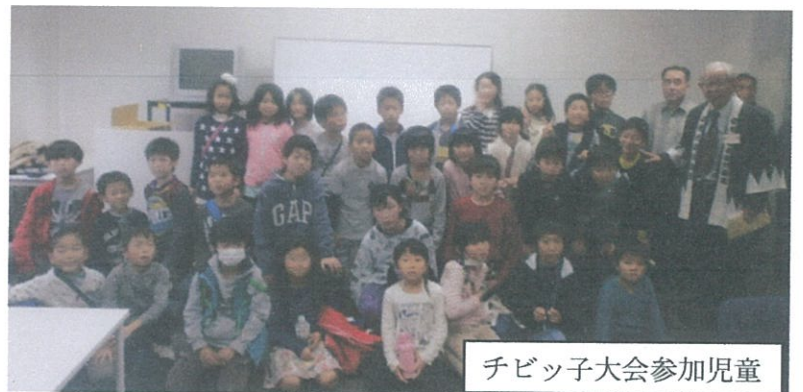
チビっ子大会参加児童