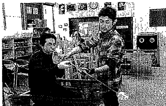
↑ガラススタジオでの吹きガラス体験の様子

参加者は「吹きガラスは一瞬にして形が変わるので難しかったが、素敵なグラスができた」と喜んでいました。