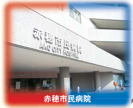
病院玄関前にとまります

備前ルートの次の区間は「フリー乗降区間」となります。停留所以外の場所でも乗降できます。 ○「金谷西」～「畑」 ○「土師神根」集落 (乗車するとき)手を挙げて、運転手に合図してください。 (降車するとき)あらかじめ、運転手にお知らせください。