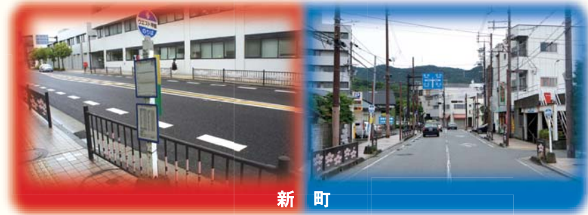
(備前ルート) 新町はルートにより停留所位置が異なります (上郡ルート)