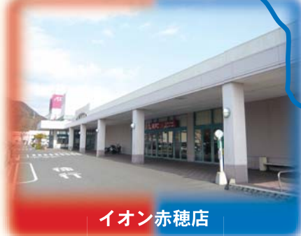
イオン内マクドナルド前にとまります