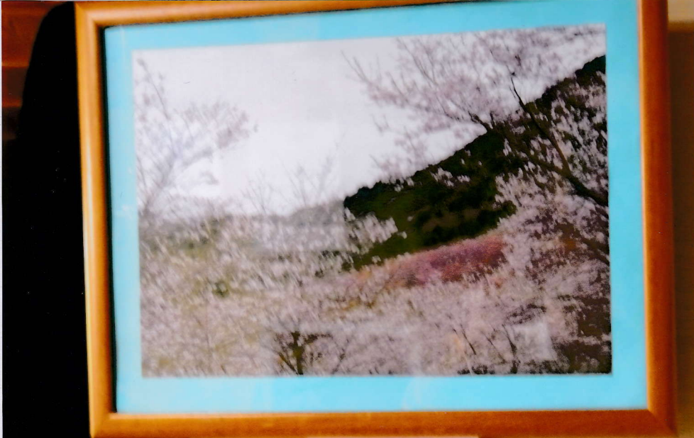
桜山 上郡ビュアランド