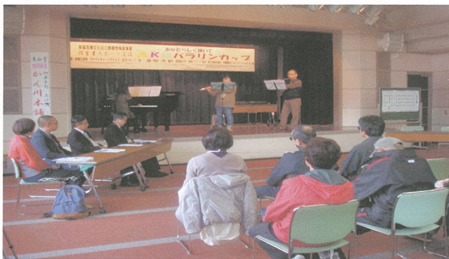
写真のコメント STT 大会(総合福祉会館) 開会式オープニングセ レモニーのフルート演奏