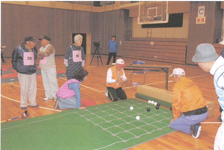
写真のコメント 上郡大会 (B&G アリーナ) 囲碁ボール競技後の採点風景