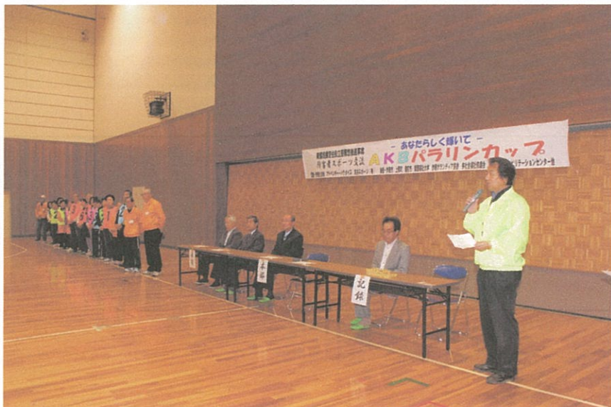
写真のコメント 上郡大会 (B&G アリーナ) 開会式風景