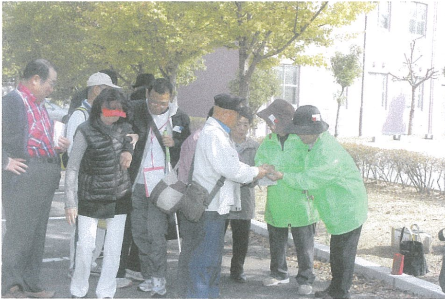
写真のコメント ウォーキング大会 チェックポイントでボ ランティアからスタ ンプをもらう