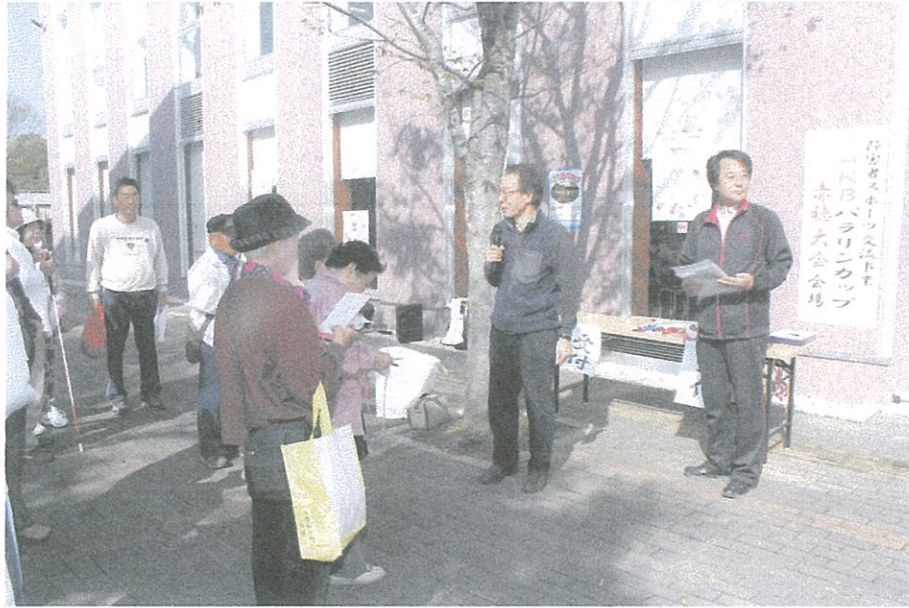
写真のコメント ウォーキング大会 開会式