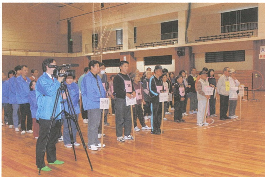
写真のコメント 上郡大会 (B&G アリーナ) 開会式風景 TV も取材 に来ました