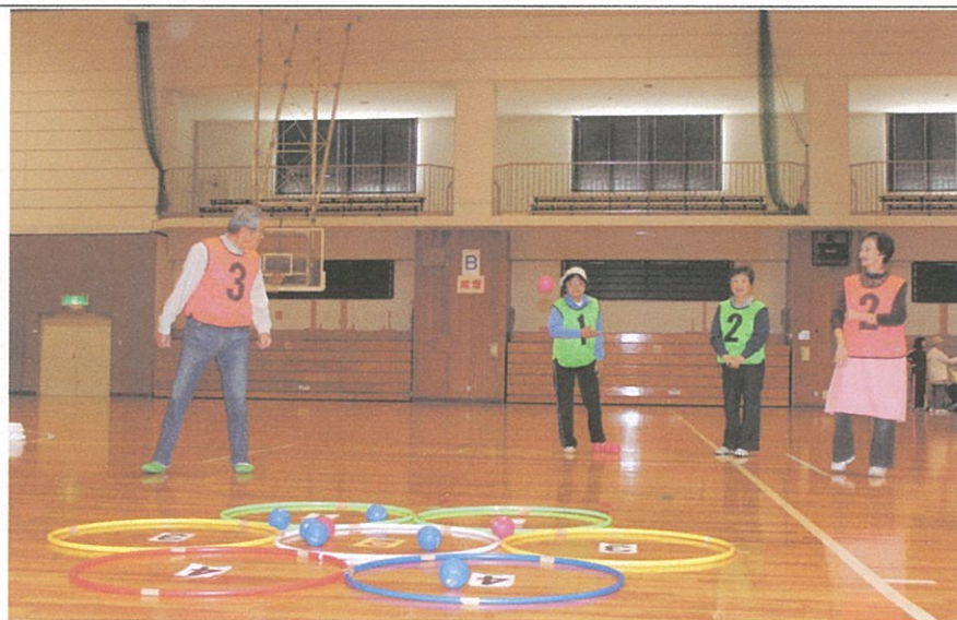
写真のコメント。 上郡大会 (B&G アリーナ) ボッチャーのリハーサ ル