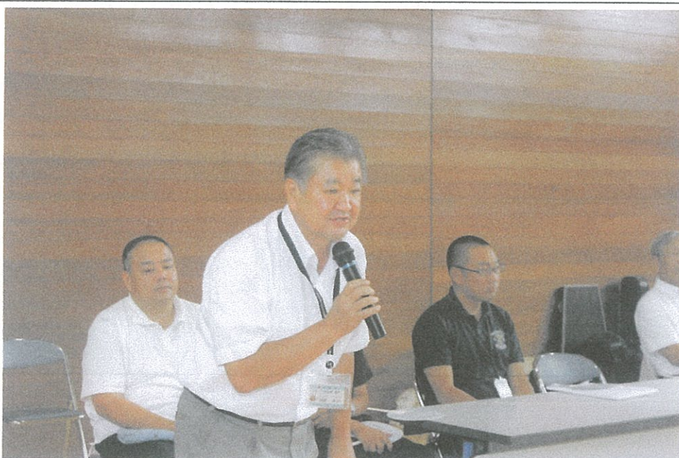
写真のコメント 赤穂大会 関西福祉大学体育館 で開会式風景 来賓挨拶