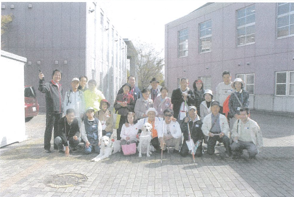
写真のコメント ウォーキング大会 歩き終えて記念写真