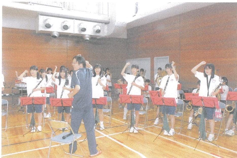
写真のコメント 赤穂大会 関西福祉大学体育館 で開会式風景 オープニングセレモ ニーを飾った赤穂中学 校吹奏楽部