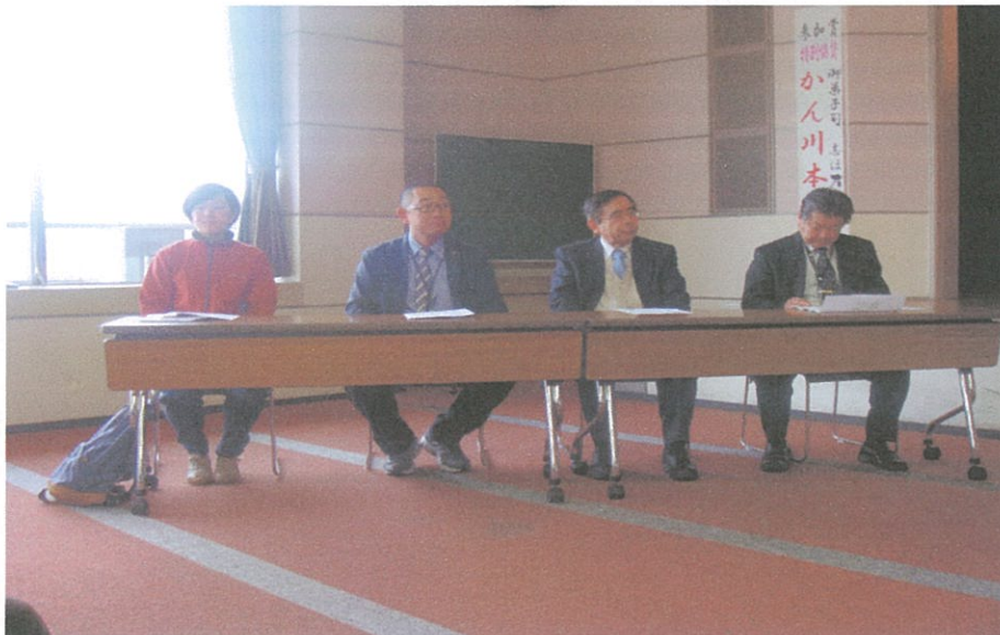
写真のコメント STT 大会(総合福祉会館) 開会式来賓席