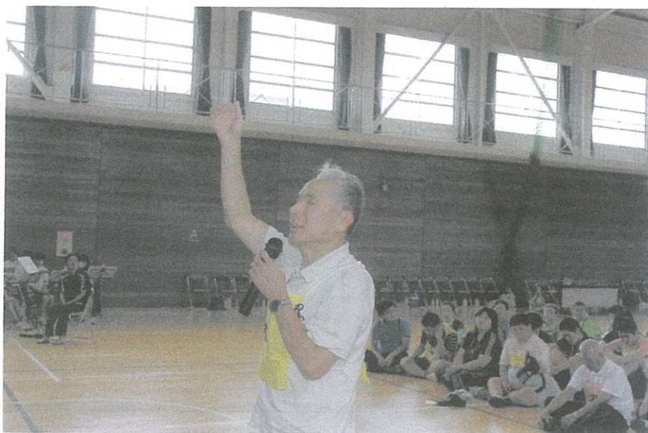
写真のコメント 赤穂大会 関西福祉大学体育館 で開会式風景 選手宣誓