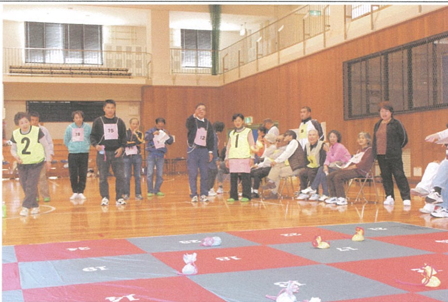
写真のコメント 上郡大会 (B&G アリーナ) スローイングビンゴ競技風景