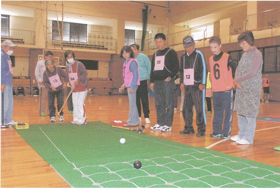
写真のコメント 上郡大会 (B&G アリーナ) 囲碁ボール競技風景