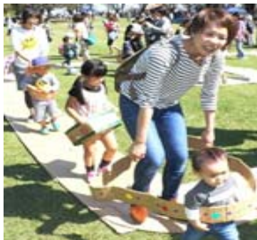
ダンボールで電車ごっこ